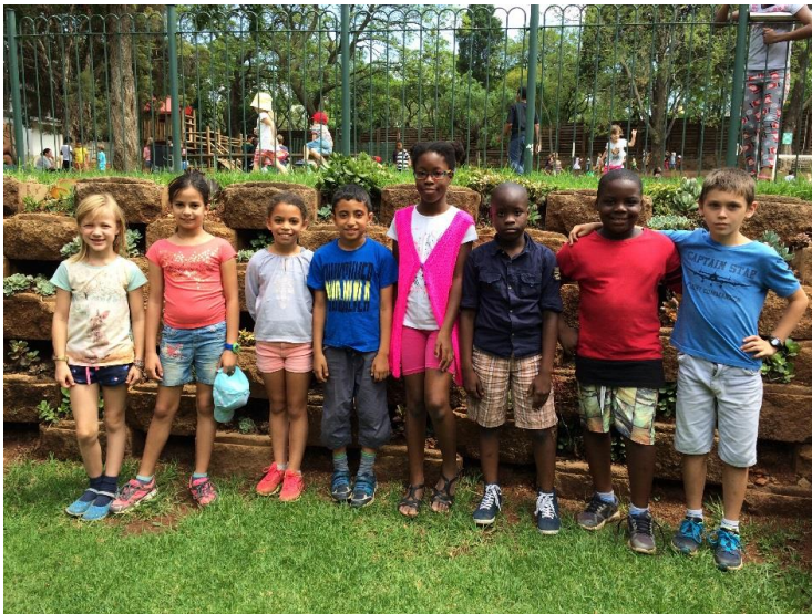
Photo : les délégués du CE1 au CM2.

Jeudi 24 novembre, le conseil des élèves de Pretoria s'est réuni pour la première fois, pour faire des propositions et discuter de sujets visant à améliorer l'environnement scolaire des élèves. Des échanges riches et constructifs à poursuivre tout au long de l'année.